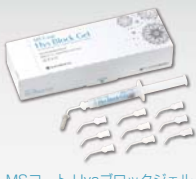
MSコート Hysブロックジェル

ダイレクトに塗布が可能で、こすり塗りも不要になったジェルタイプの知覚過敏抑制材料です。MSコートシリーズの高い知覚過敏抑制効果を継承し、さらにカリウム塩を配合しました。また、フッ化ナトリウムによる耐酸性効果で、適用歯面の酸による脱灰を抑制します。