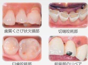
歯質くさび状欠損部