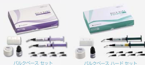
バルクベース セット