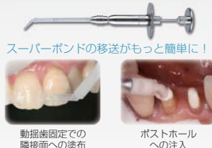
スーパーボンドの移送がもっと簡単に！