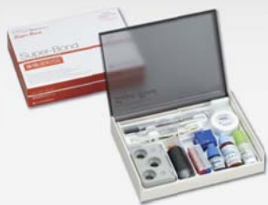
スーパーボンド 筆積混和SEセット

説明会希望製品を以下よりお選びいただき、FAXまたはお出入りの歯科商店様までご連絡下さい。