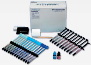
メタカラー プライムアートスタンダードセット