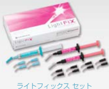
ライトフィックス セット

ワンペースト、光硬化型の動揺歯固定用接着材料です。外傷固定や軽度の膿漏固定など、治療スピードが求められる動揺歯固定に適しています。