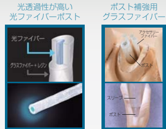
光透過性が高い 光ファイバーポスト