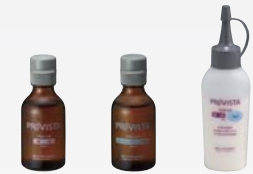
プロビスタ 液材 プロビスタ スーパークイック液材 プロビスタ 粉材 A2