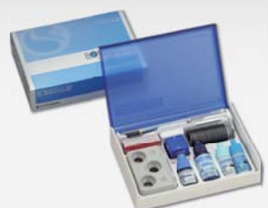
ボンドフィルSBセット