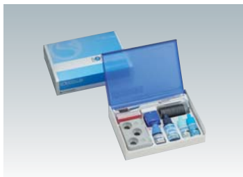
歯科充填用アクリル系レジン ボンドフィルSB (管理医療機器) 医療機器認証番号 222AFBZX00133000