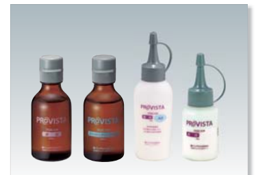
歯科汎用アクリル系レジン プロビスタ (管理医療機器) 医療機器認証番号 220AFBZX00245000

歯面処理材 ティースプライマー (管理医療機器) 医療機器認証番号 222AFBZX00100000