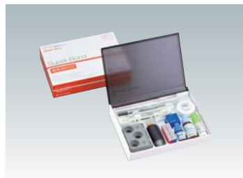
歯科接着用レジンセメント スーパーボンド (管理医療機器) 医療機器認証番号 221AABZX00115000