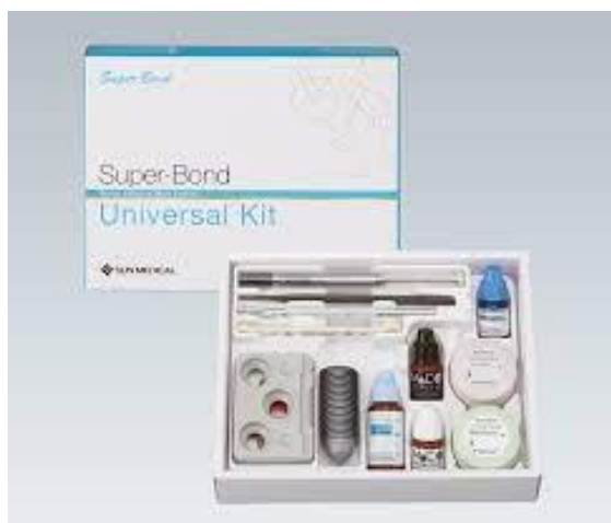
Image: Super-Bond™, now set to be sold in Brazil (actual product will differ from image.)

Employing 4-methacryloxyethyl trimellitate anhydride (4-META) as a dispersion-aiding monomer and tributylborane (TBB) as a polymerization initiator, Super-Bond™ is an acrylic resin cement made for use as a dental adhesive. It is referred to in academic literature as a 4-META/MMA-TBB resin. SUN MEDICAL began producing and selling the product in 1982, and since sales first began in Japan, the material has become a favorite among dentists due to its excellent adhesive properties and ample track record of effectiveness. Super-Bond™ finds use in a wide range of applications, including stabilizing mobile teeth, forming direct resin-bonded bridges, and enabling the adhesion of brackets and ceramic prostheses. The material enjoys widespread use in clinical settings around the world, with exports already going out to the U.S., Europe, China and South Korea.