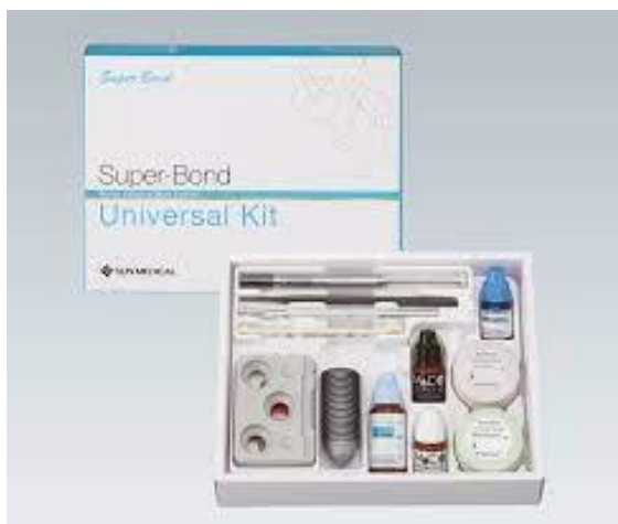
図 ブラジルで販売するスーパーボンド®

松風、サンメディカル及び三井化学の三社業務提携の成果として、スーパーボンド®の薬事認可をブラジルで取得、販売を行うことで、歯科用接着材料のシェア拡大を図るとともに、ブラジルの歯科医療に貢献してまいります。